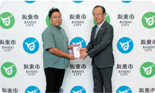
▲(有)三郷解体茨城リサイクルセンター

社協本所・社協支所(土曜、日曜、祝日除く、午前8時30分から午後5時15分まで)