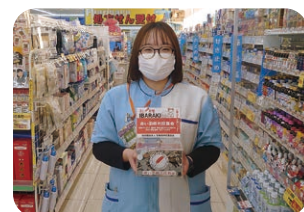
ウエルシア薬局 坂東岩井本町店