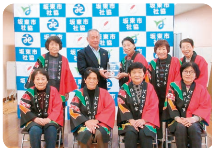
岩井地域女性委員会