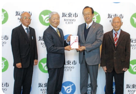
岩井グラウンド・ゴルフ協会