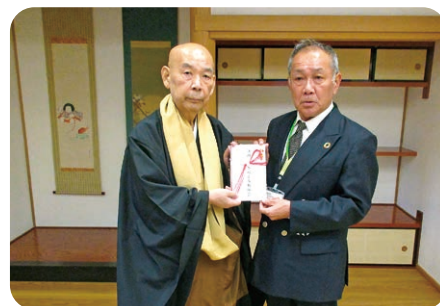
真言宗豊山派 茨城県布教師会